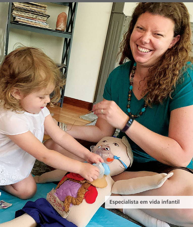
Especialista em vida infantil